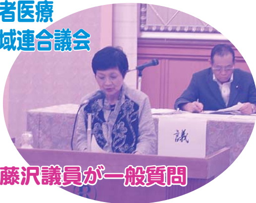
藤沢議員が一般質問